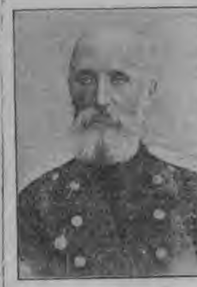
Председатель Верховной следственной комиссии.

В Рижском направлении происходят серьезные боевые действия. Наши войска активно ведут наступательные операции, стремясь расширить фронт.